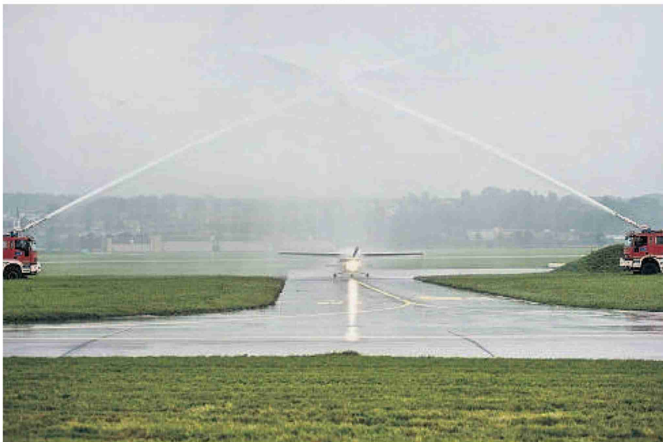
Es ist offen, ob Abenteurer Carlo Schmid eine neuerliche Weltumrundung wieder in Dübendorf beenden könnte.

Der Aviatik-Dachverband Aerosuisse hat die Kräfte für eine zivile Nutzung des Flugplatzes Dübendorf gebündelt